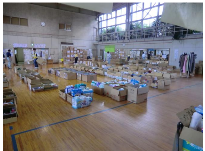
↑ 体育館には全国から寄せられた物資が集められている