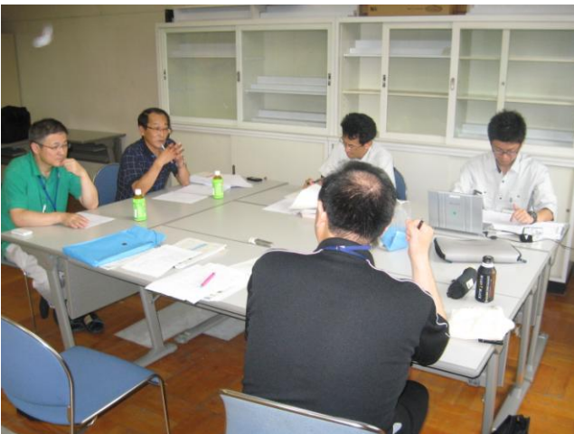
↑ 双葉町職員から事故発生後の経緯などについて聴取