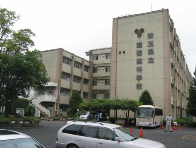
↑ 双葉町が災害対策本部を置く「旧埼玉県立騎西高等学校」