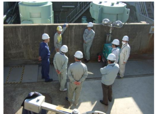
↑ 既設（T.P. +4.9m）の防護壁

同社としては、茨城県の防災指針に示されている津波高さ2～7mの一番高い津波に対応させるためさらなる検証を行い、さらに+1.5mのかさ上げを検討し、今後実施予定である。