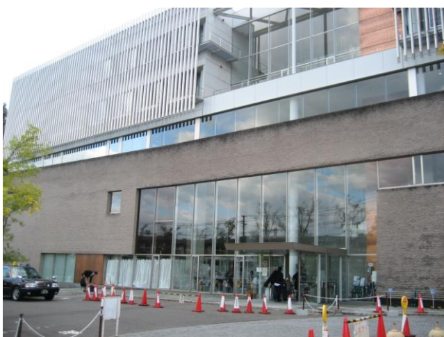
↑ 浪江町が災害対策本部を置く「福島県男女共生センター」