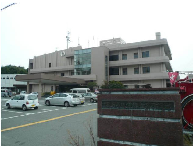
↑ 警戒区域内の檜葉町役場