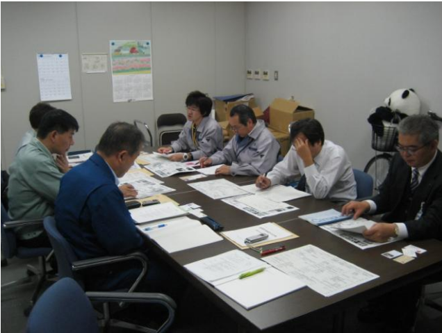
↑富岡町職員から事故発生後の経緯などについて聴取