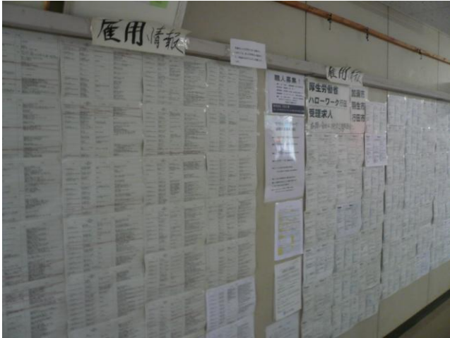
↑廊下には、住民への情報提供として雇用情報等がはり出されている