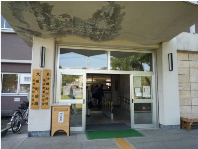
↑大熊町が災害対策本部を置く「会津若松市役所追手町第二庁舎」