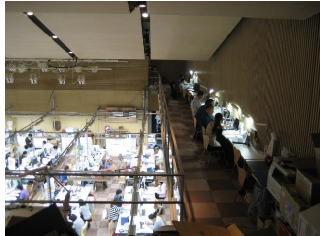
↑職員は、業務場所を確保するため2階通路スペースをも活用している