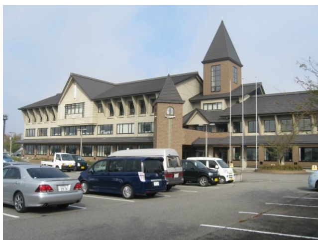
↑ 檜葉町が災害対策本部を置く「会津美里町役場本郷庁舎」