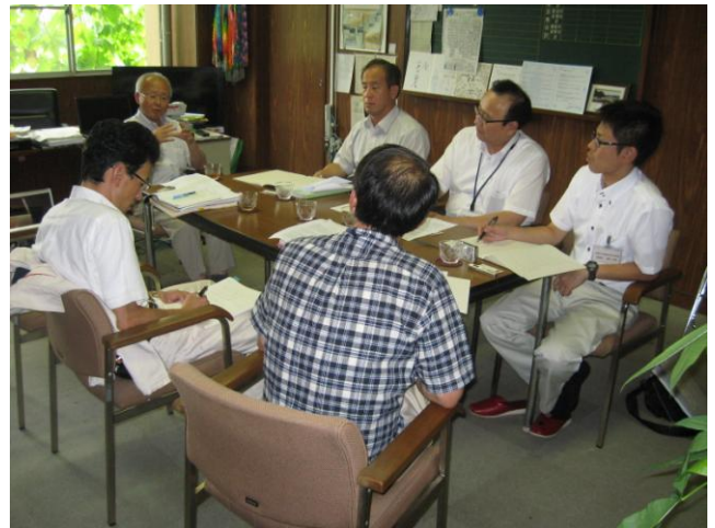
↑ 井戸川克隆双葉町長から原子力災害について話を伺う