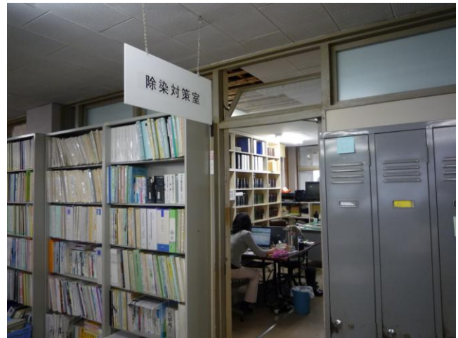
↑事故後、国内で初めて設置された除染対策室