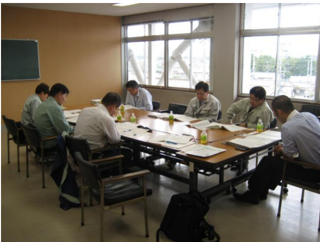
↑南相馬市職員から事故発生後の経緯などについて聴取