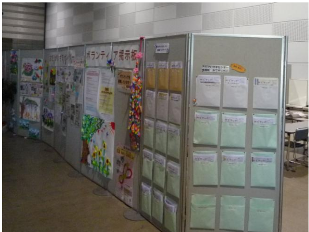
↑ホール内にはボランティアに関する情報などがはり出されている