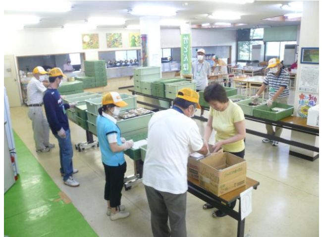
↑避難住民の食事は、地元ボランティアにより支えられている