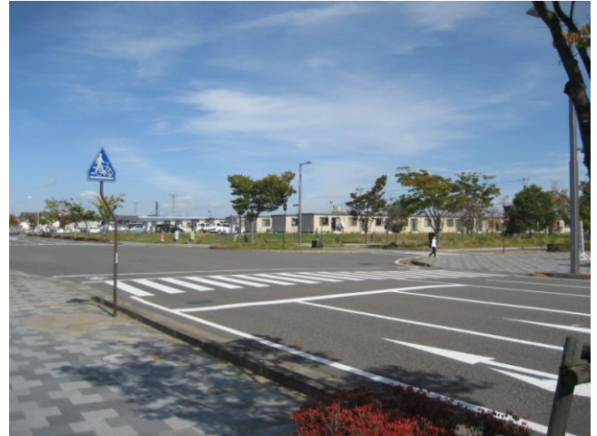
↑郡山市内に整備された仮設住宅