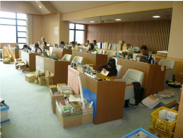
↑ 職員は議場をはじめ、3階フロアに分散し業務を行っている