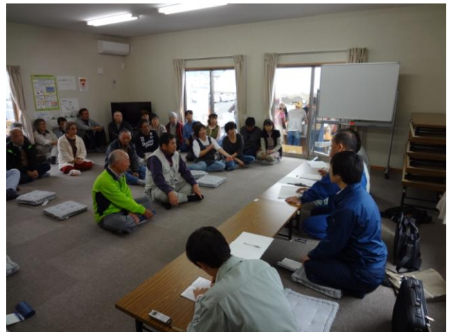
↑仮設住宅で大熊町民の方々と意見交換