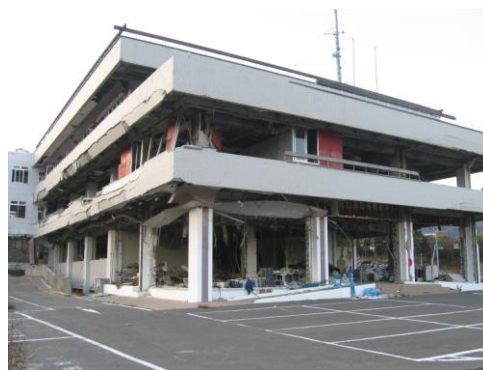
↑ 3階部分まで水没した女川町役場