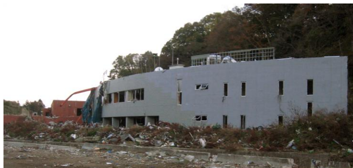
↑ 津波の到来により損壊した宮城県原子力防災対策センター（オフサイトセンター）