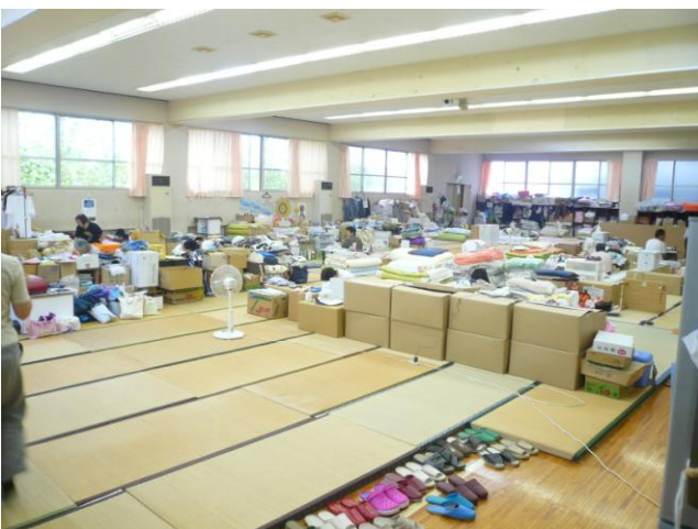
↑ 避難住民は剣道場をはじめ各教室などで生活を余儀なくされている