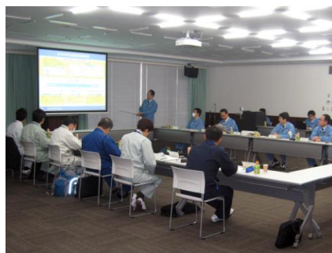
↑ 地震後の発電所の状況や緊急安全対策について説明を受ける