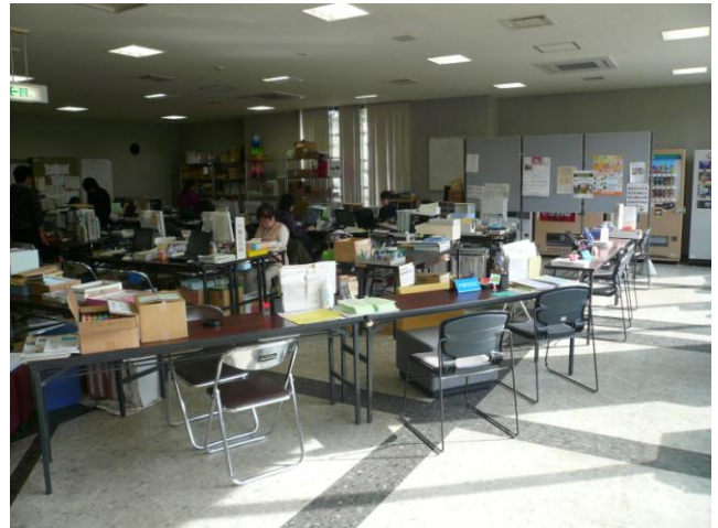
↑ 1階には避難住民の対応窓口が設置されている