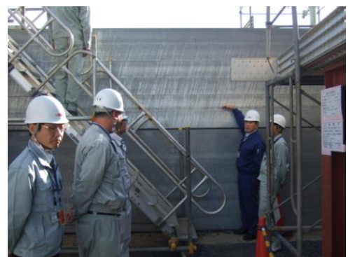
↑ 茨城県ハザードマップを受け止め、6.1mの防護壁を設置（調査員の示す位置は津波が到来したライン）