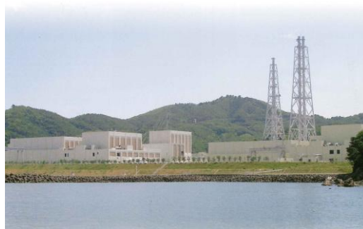
↑ 東北電力㈱女川原子力発電所

女川原子力発電所は、東北電力㈱として最初に取り組みされた原子力発電所であり、三陸海岸の南端にある牡鹿半島の中ほど、宮城県牡鹿郡女川町塚浜字前田 1 番に位置するが、一部は石巻市に含まれており、面積 173 万 m 2 の敷地を有している。