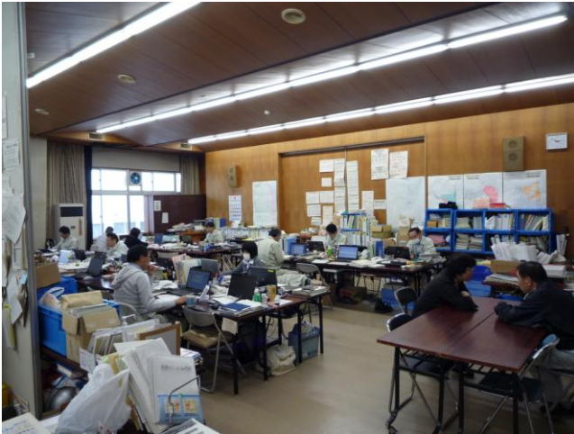
↑職員は事故に伴う業務や住民対応に追われている