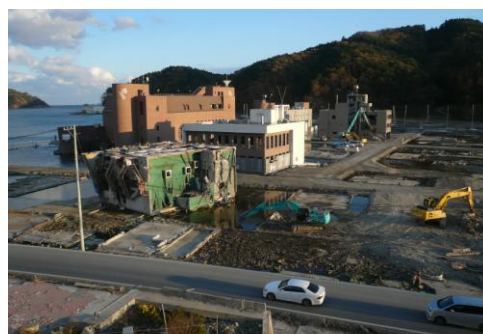
↑ 海に面した施設や住居は壊滅的な被害を受けた