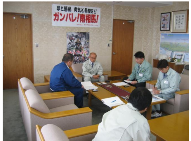
↑桜井勝延南相馬市長から原子力災害について話を伺う