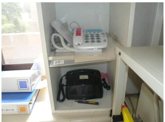
↑ 檜葉町役場に設置されていたホットライン（上：福島第一原子力発電所用、下：福島第二原子力発電所用）