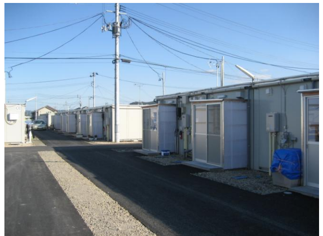
↑福島市内に整備された仮設住宅