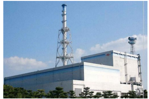
↑ 日本原子力発電(株)東海第二発電所

なお、同敷地内の東海発電所は、日本初の商業用原子力発電所として昭和 41 年 7 月から 30 余年にわたり発電をしてきた電気出力 16 万 6,000kW の黒鉛減速・炭酸ガス冷却炉であるが、平成 10 年 3 月 31 日に営業運転を終了し、現在廃止措置が行われている。