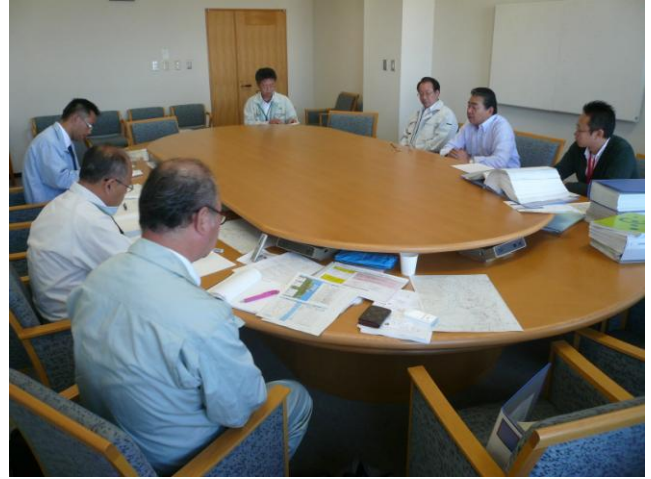
↑ 檜葉町職員から事故発生後の経緯などについて聴取