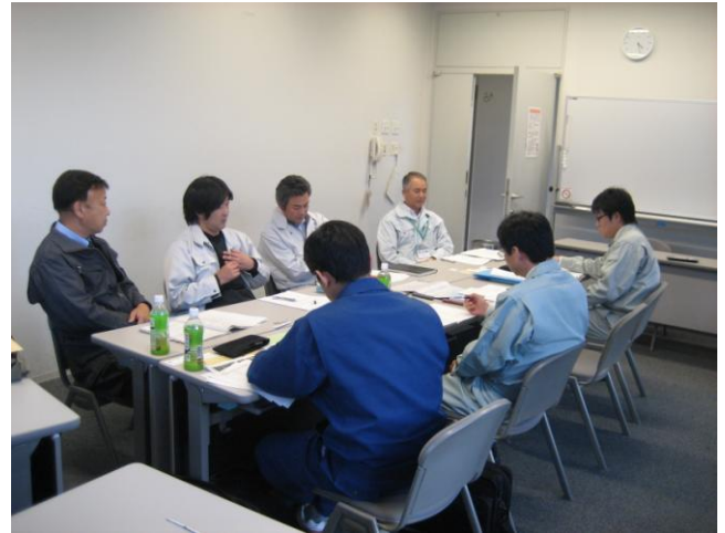
↑浪江町職員から事故発生後の経緯などについて聴取