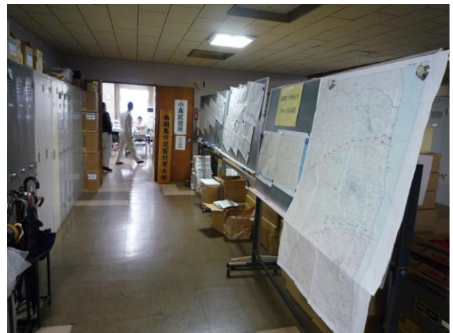
↑災害対策本部前には、様々な資料が張り出されている