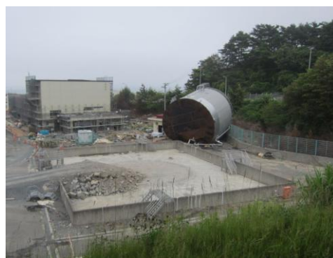
↑津波到来により倒壊した重油貯蔵タンク

その結果、同社が提示した敷地高さ案でよいと集約され、敷地高さをO.P.+14.8mとすることを社内決定している。