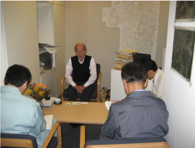
↑馬場有浪江町長から原子力災害について話を伺う