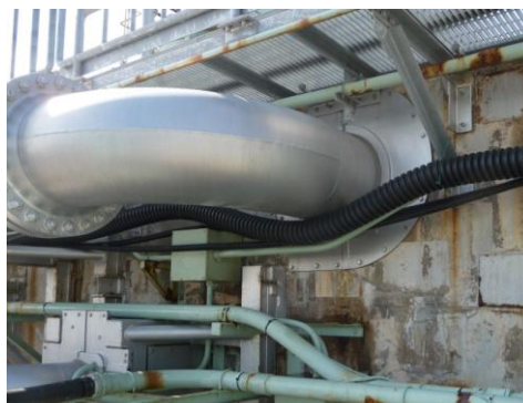
↑シール施工済みの配管貫通部

事業者との意見交換の中で、日本原子力発電(株)は一民間企業ではあるが、公益的企業として、また、原子力発電所を稼働させている企業としての責任感、使命感を持って取組んでいるという会社の理念、あるいは自負といったものを感じることができ、これが今回の津波対策への取組であったと考えられる。