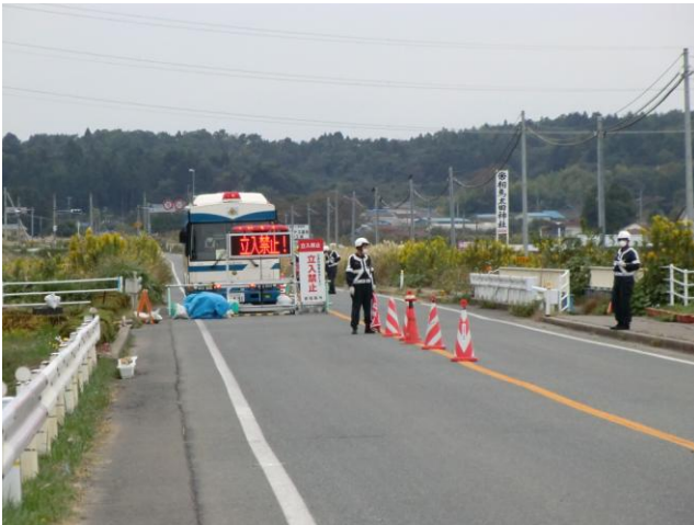
↑警戒区域の境界では警察による取り締まりが行われている