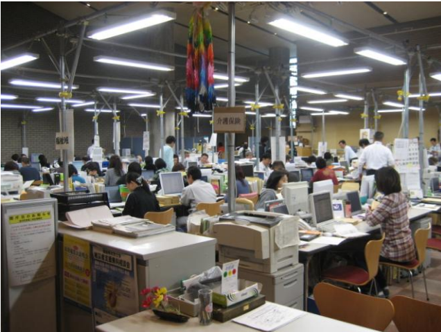
↑職員は、研修ホールを利用し事故に伴う業務や住民対応に追われている