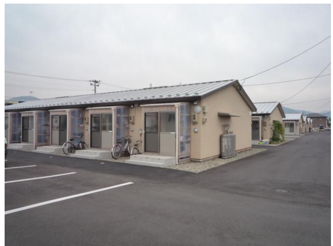
↑会津若松市内に整備された仮設住宅