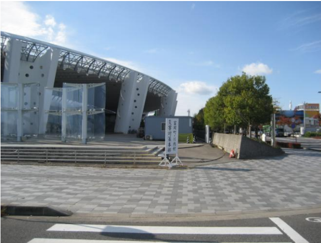
↑富岡町が災害対策本部を置く「郡山市ビックパレットふくしま」