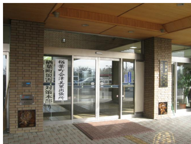
↑ 正面玄関には「檜葉町会津美里出張所」の表示がされ、1階・3階を使用している