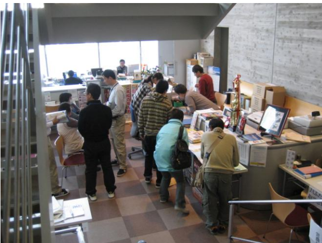
↑1階には避難住民の対応窓口が設置されている