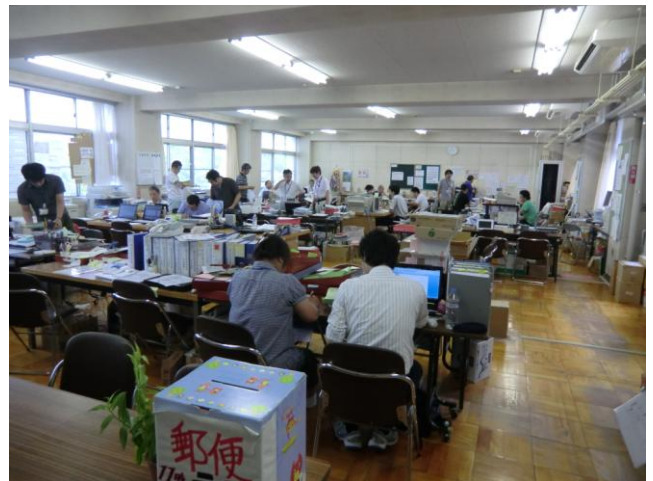
↑ 旧職員室に設置されている災害対策本部