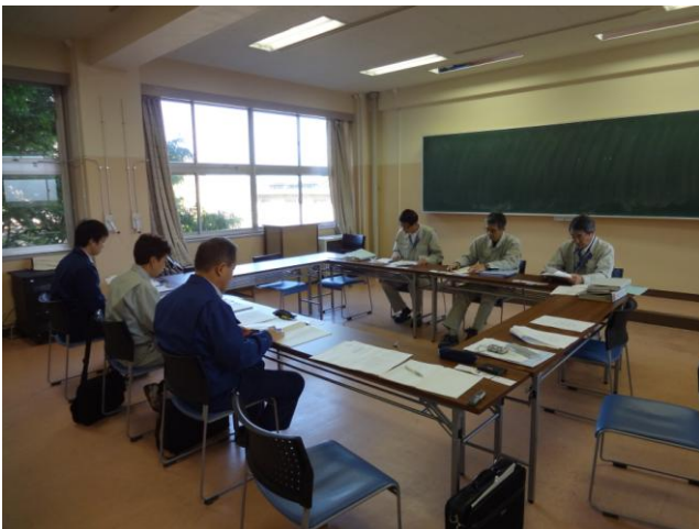
↑大熊町職員から事故発生後の経緯などについて聴取