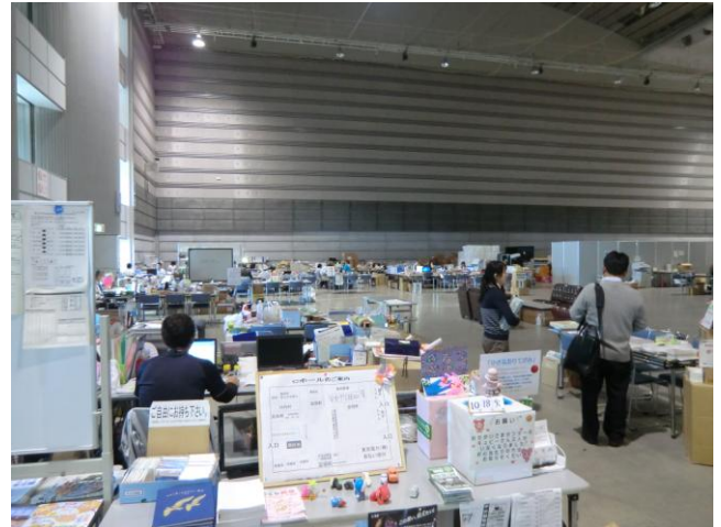
↑職員は、ホールをはじめ各事務室を利用し業務を進めている