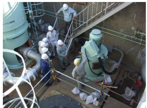
↑ 水没した非常用ディーゼル発電機冷却用海水ポンプ 2C (写真右)

地震発生時、同発電所は通常運転中であり、地震を感知後自動停止した。地震発生後は外部電源を喪失し、津波の影響を受け非常用ディーゼル発電機の一部が使用不能となったが、3 月 15 日には予備外部電源の復旧により原子炉の冷温停止常態を確保している。