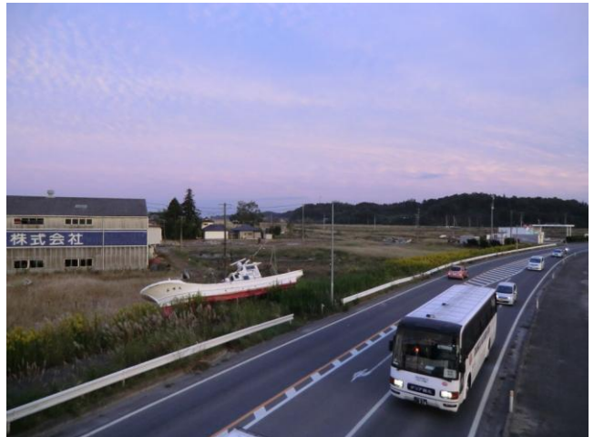
↑太平洋から約3km離れた国道6号線横にも漁船が流され、津波の遡上範囲の広さを確認できた