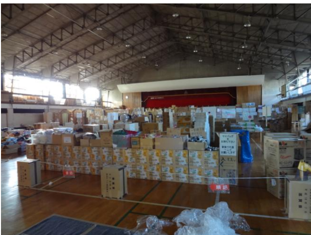
↑体育館には全国から寄せられた物資が集められている