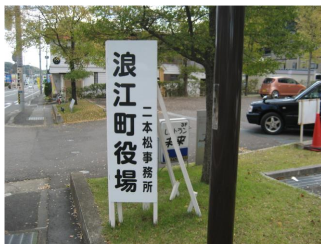
↑ 浪江町役場は二本松事務所のほか、3ヶ所にも出張所を置いている(調査日現在)