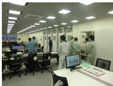
↑プラント状況や情報連絡等で使用する緊急対策室