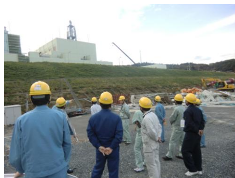
↑ 発電所をはじめとする安全上重要な設備は敷地高 O.P. +13.8m（地震前は O.P. +14.8m）に整備されている

今後、国などで行われている事故原因の究明、調査結果に基づく対応策が明らかにされることになると考えるが、この過程を注視するとともに、結果から得られる教訓・知見や同社としての見解を反映することにより、原子力発電所の安全性の一層の向上を目指すとしている。