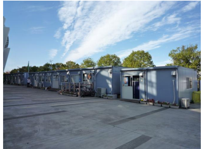
↑「ビックパレットふくしま」の敷地内にはプレハブが設置され、富岡町と川内村の職員が業務を行っている