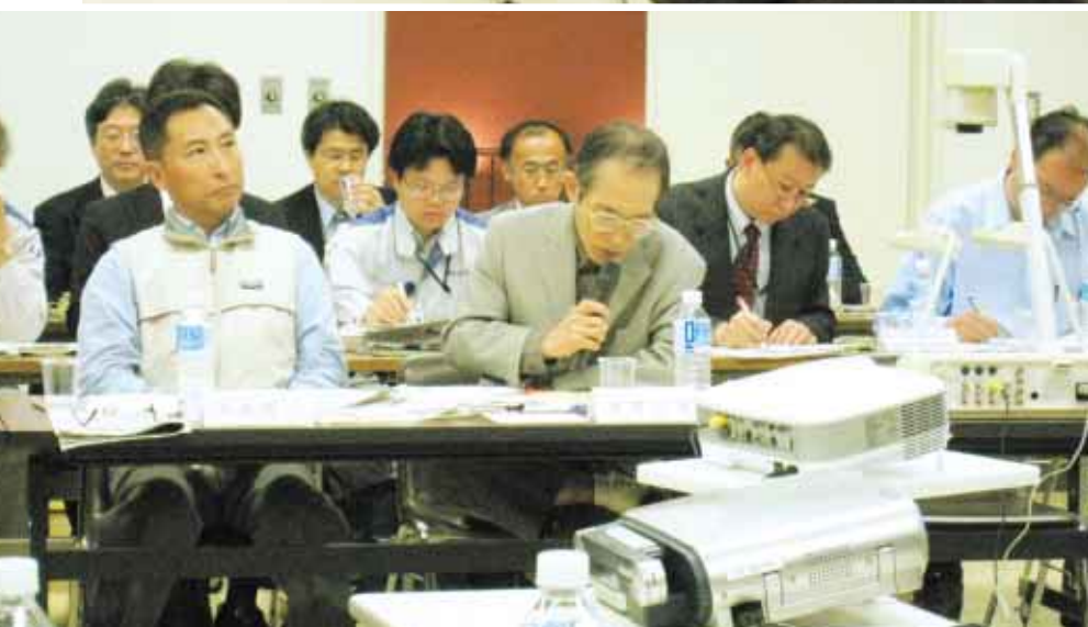
◀第60回定例会（柏崎原子力広報センター）