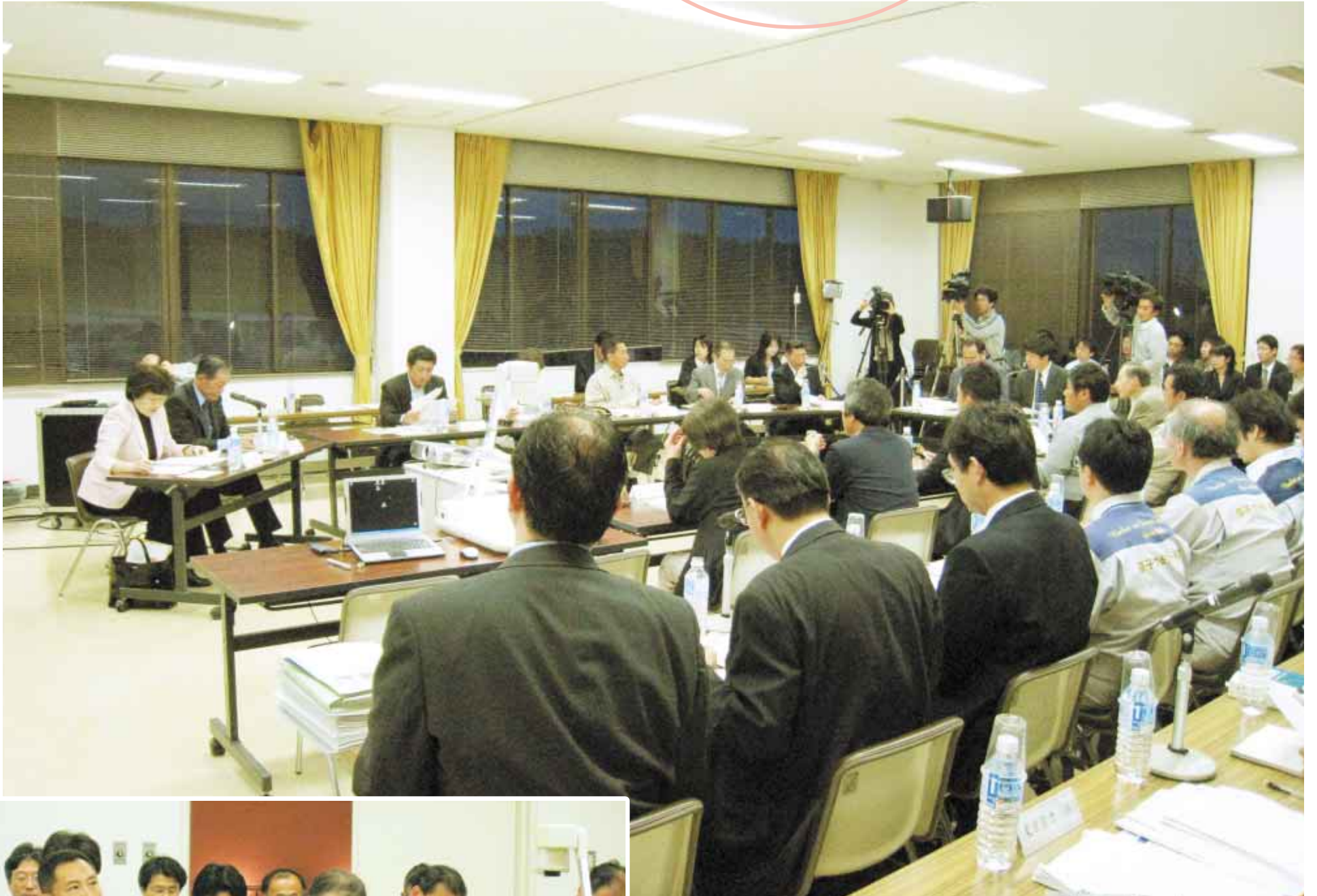
▲第59回定例会（柏崎原子力広報センター）